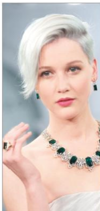
模特现场展示 ENZO 高级珠宝

作为彩色珠宝权威,ENZO同时还提供全新设计风格和适宜各阶段周年纪念日的丰富彩色珠宝系列。如2011年春季的碧玺系列,就以神秘、流动的色泽和独具匠心的款式,及其幸运、幸福的寓意,打造出高贵优雅的“碧玺新娘”。由此可见,ENZO Wedding Collection 婚庆系列,将为每一对幸福新人创造多彩的人生和永恒的记忆。