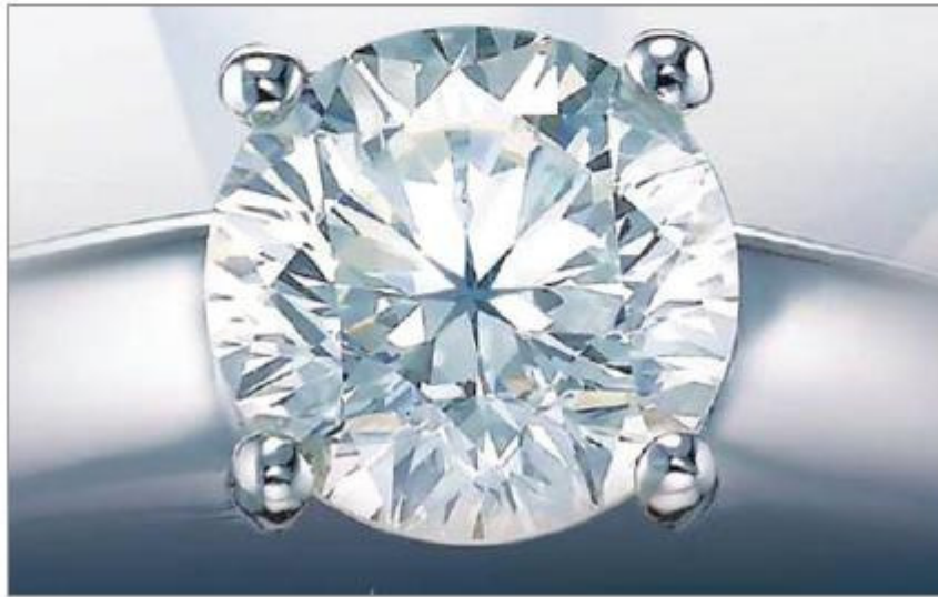
89个精准切面的SWANA婚戒

据悉,每颗SWANA钻石均由以世界首创的“SWANA切工”技术打造,打破传统明亮型切割的58个切面,具有89个精准的切面,反光程度高。其中,SWANA的Adore系列首饰均有由黄金打造的八角星点缀,并有婚戒及吊饰可供选择。