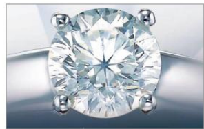
89个精准切面的SWANA婚戒

面令钻石格外璀璨光芒。据悉,每枚SWANA 钻石均由以世界首创的“SWANA 切工”技术打造,打破传统用典型切面的58个切面,具有89个精准的切面,反光更亮丽。其中,SWANA的Aloze系列首饰均由黄金打造成的八角星点,并有镶嵌及吊饰可供选择。