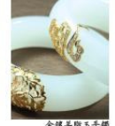
金镶羊脂玉戒面戒指