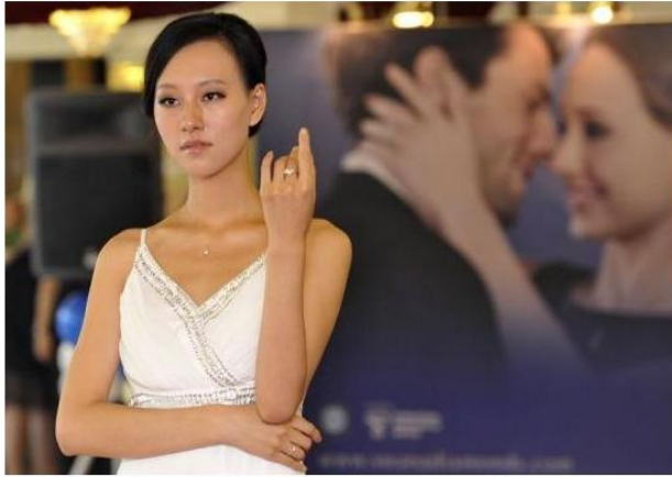
89刻面钻石惊艳来蓉

日前,来自世界一流钻石产地——非洲博茨瓦纳的SWANA诗梵诺钻石在成都爱心旗舰店举办“89刻面SWANA钻石推广会”,给成都的百余位嘉宾带来了非凡的视觉享受。据了解,即日起至10月10日,每购买一颗SWANA钻石均可免费镶嵌K金戒托,还有机会抽取30分的SWANA裸钻。