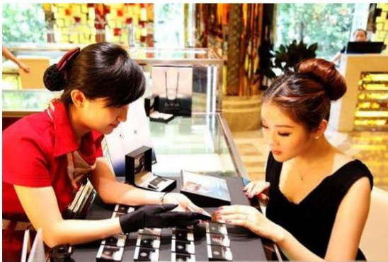
钻石备受美女的追捧