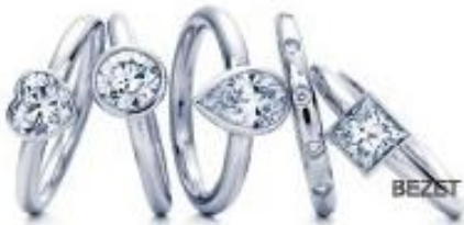
BEZEL 系列经典五款钻戒 - TIFFANY