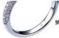
梦幻系列 - JAFF