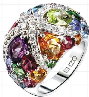
海洋系列彩宝戒指

顺应这个五彩缤纷的年代，ENZO 推出了彩色宝石系列，色彩明丽的天然宝石，通过别出心裁的设计，包装，为已成经典的 ENZO 增添新的魅力。 茂业华强店