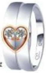
心心相印 - 钻石珠宝