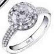
华贵系列 - JAFF