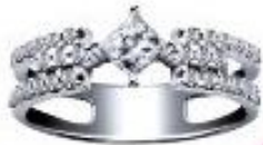
FOREVERMARK - 周生生