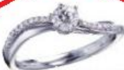
MAGNIFIQUE 系列 - SWANA