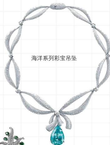
海洋系列彩宝吊坠