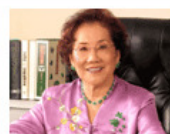
欧阳秋眉翡翠讲座